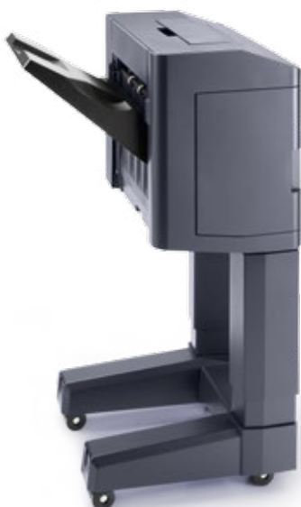
1.000-BLATT-FINISHER DF-5110 Externer Finisher für große Druckmengen. Heftet bis zu 50 Blatt an 3 Positionen; optionales Locher von Dokumenten.