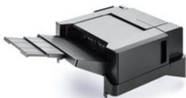
300-BLATT-FINISHER DF-5100 Ablagekapazität von bis zu 300 Blatt. Heftet bis zu 50 Blatt an 3 Positionen.