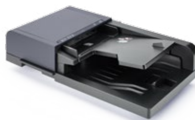
ORIGINALEINZUG MIT WENDUNG DP-5100 Der 75-Blatt-Originaleinzug scannt automatisch doppelseitige Dokumente in den Formaten A6 bis A4; Banner bis 1.900 mm.